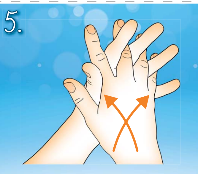
5. Dejte ruce k sobě dlaněmi. Zaklesněte prsty. Třete dlaněmi o sebe ze strany na stranu.