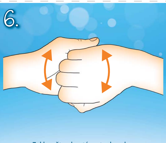
6. Zaklesněte ohnuté prsty do sebe. Třete hřbet prstů pravé ruky o dlaň ruky levé a naopak.