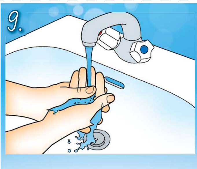
9. Opláchněte ruce pod tekoucí vodou.