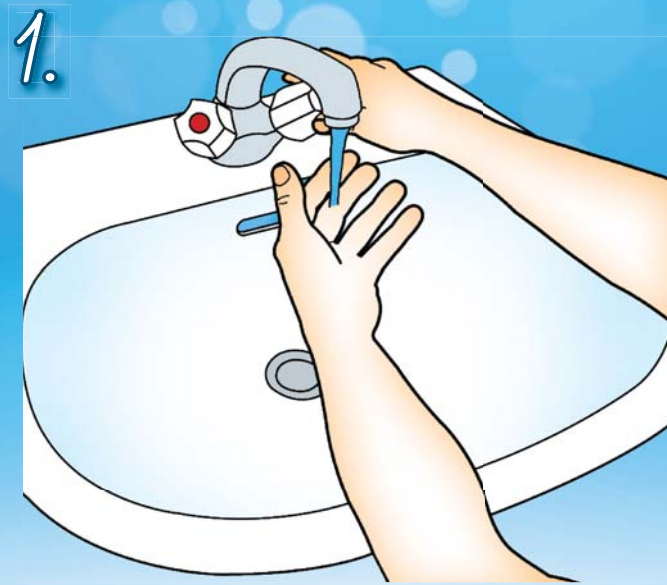
1. Navlhčete si ruce pod tekoucí vodou.