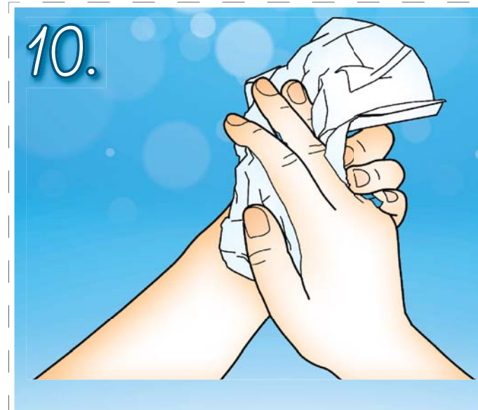
10. Ruce si pečlivě osušte. Jednorázový ručník použijte k zastavení kohoutku.