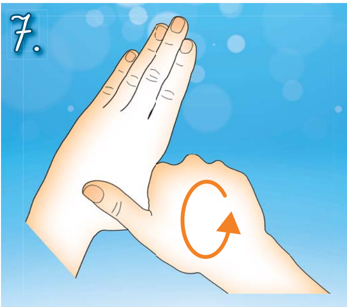
7. Třete krouživým pohybem levý palec v sevřené pravé dlani. Pak ruce vyměňte.