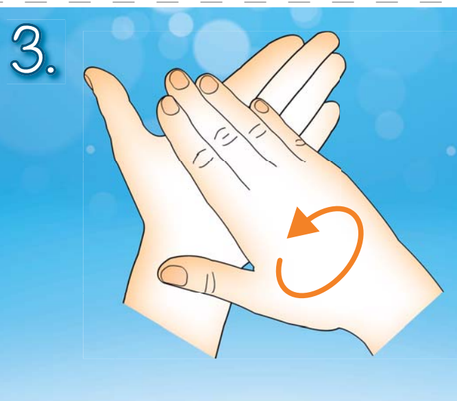
3. Třete dlaní o dlaň krouživým pohybem.