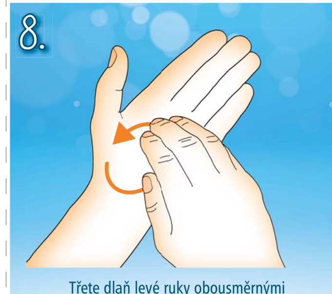
8. Třete dlaň levé ruky obousměrnými krouživými pohyby sevřených prstů pravé ruky. Pak ruce vyměňte.